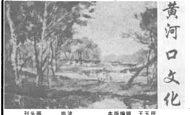
刊头画 尚波 本版编辑 王玉民

广饶讯 由石村乡韩瞳村和县文化被图书馆联袂举办的广饶县“小康杯”书画展 不久前在县图书馆举办。这次展览 共展出了120位作者的142件书画作品。这些作品大部出自农民业余书画爱好者之手 作品风格各异 书画并茂、从不同的角度 不同的侧面集中反映了“一心奔小康”的夙愿与激情。展示了新一代农民在改革开放新形势下的时代追求与精神风貌 基本上代表了全县农民书画队伍的整体水平。(冠麟 丁玲)